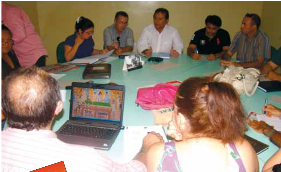
Reunião de diretoria do MOVA-SE: após visita aos órgãos, o colegiado se reúne para formar a proposta de reivindicações para o FUASPEC