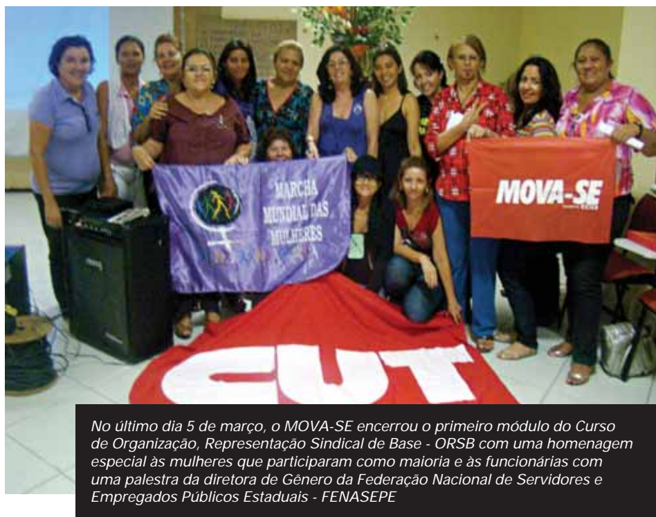
No último dia 5 de março, o MOVA-SE encerrou o primeiro módulo do Curso de Organização, Representação Sindical de Base - ORSB com uma homenagem especial às mulheres que participaram como maioria e às funcionárias com uma palestra da diretora de Gênero da Federação Nacional de Servidores e Empregados Públicos Estaduais - FENASEPE