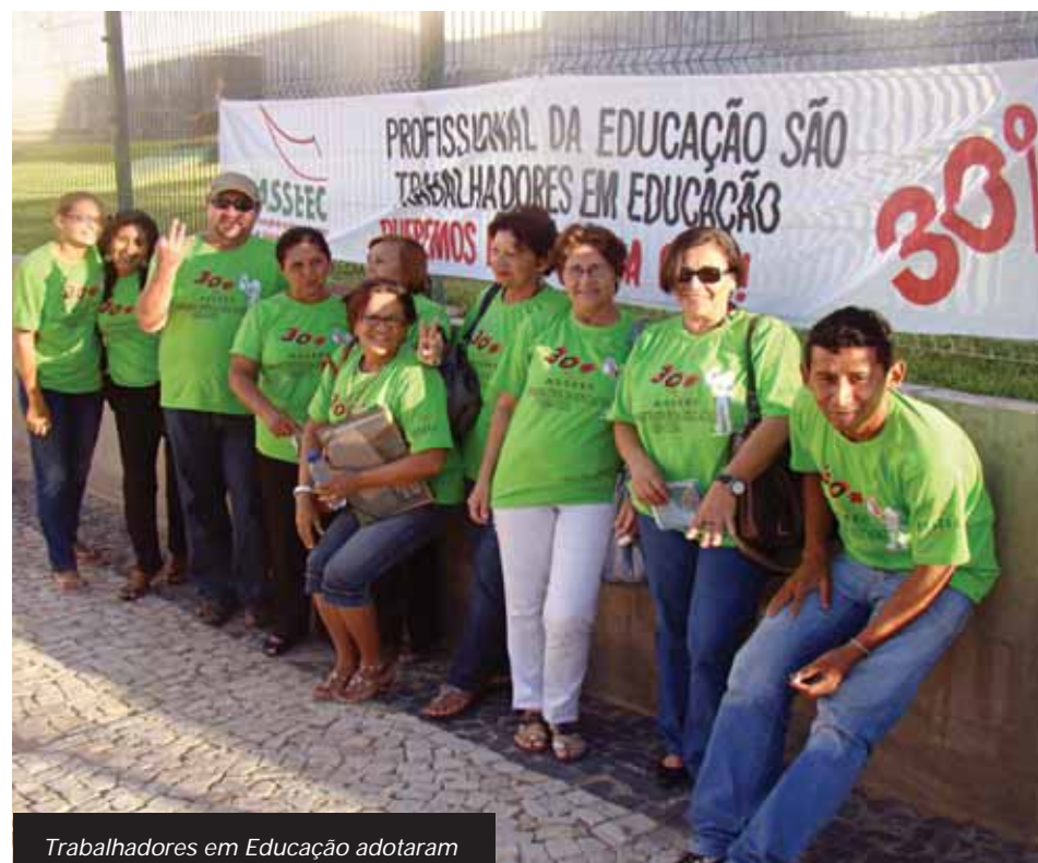
Trabalhadores em Educação adotaram a camisa verde da campanha

Na quinta-feira, 18/03, a Comissão de Educação da Assembleia Legislativa com o apoio do MOVA-SE e entidades representativas de servidores em educação, deram o pontapé inicial para o lançamento da campanha "Mais Educação", que propõe aumentar de 25% para 30% os investimentos em educação no Estado. O assunto foi tratado durante reunião com o deputado Artur Bruno e teve o objetivo criar um comitê para discutir ações que deverão nortear a coleta das 57 mil assinaturas para o projeto de emenda constitucional de iniciativa popular.